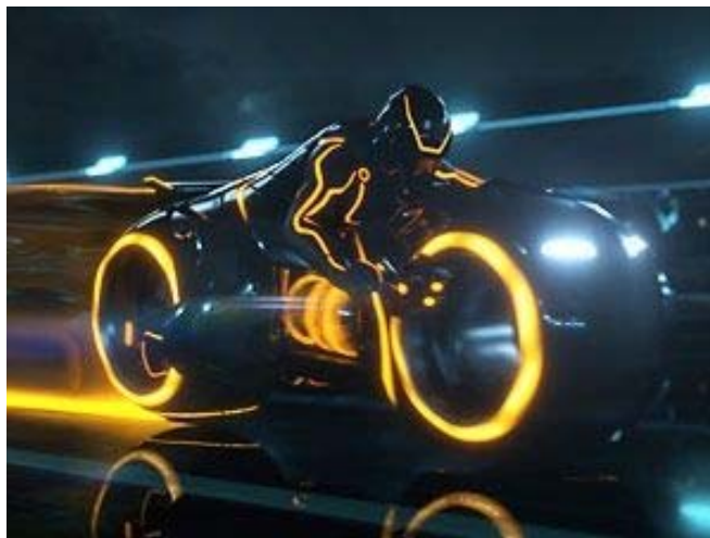
Gambar 1. Tron Legacy , Tangerang

Tron adalah sebuah film fiksi-ilmiah yang menceritakan tentang manusia setengah robot yang berlatarbelakangkan masa depan. Ciri khas dari Tron adalah kostum atau atribut yang digunakan berwarna gelap dengan garis-garis streamline bercahaya biru layaknya kehidupan futuristik. Semua peralatannya canggih dan yang terutama adalah motor balap yang digunakan pada arena pertandingan dalam film itu. Seperti film aksi lainnya, Tron cukup populer dikalangan anak-anak, remaja, bahkan orang dewasa. Tapi khusus untuk anak-anak mereka menyukai Tron bukan hanya dari film, melainkan juga dari game dan mainan action figur -nya.