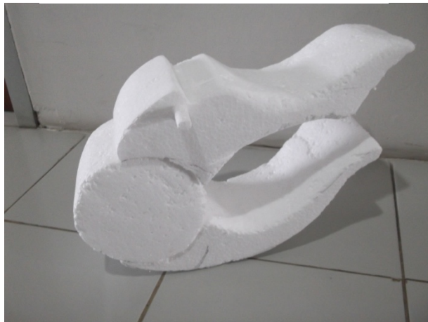
Gambar 3. Mockup Tron 1:3 Jakarta

Pada pembuatan mockup Rocking toy menggunakan bahan material styrofoam yang dibentuk dengan menggunakan amplas dan pemanas untuk memperhalus permukaannya. Mockup dibuat 1 : 3 kemudian finishing dengan di cat setelah seluruh permukaan mockup dilapisi dengan selotip kertas atau dilapisi dengan lem kayu lalu ditunggu hingga kering dan transparan agar tidak merusak styrofoam.